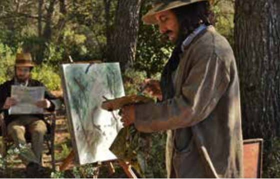
Originaltitel: Cézanne et moi