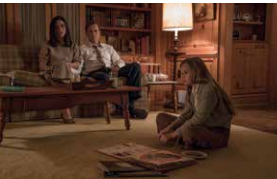
Originaltitel: American Pastoral

Der verschrobene Privatdetektiv Aloys Adorn filmt und beobachtet durch seine Kamera das Leben anderer, bis der Tod seines Vaters ihn aus seiner geordneten Bahn wirft. Als er nach einer durchzechten Nacht in einem Bus aufwacht, ist der Schock groß: Seine Kamera und Observierungsaufnahmen wurden gestohlen. Kurz darauf ruft ihn eine mysteriöse Frau an und erpresst ihn zu einem obskuren Experiment. Es ist der Anfang einer magischen Reise, auf der sich Aloys in die Stimme am anderen Ende des Telefons verliebt und die Kraft finden muss, seine Einsamkeit zu durchbrechen. ALOYS feierte auf der Berlinale 2016 in der Sektion Panorama seine Weltpremiere und gewann den FIPRESCI-Preis (Internationaler Verband der Filmkritik).