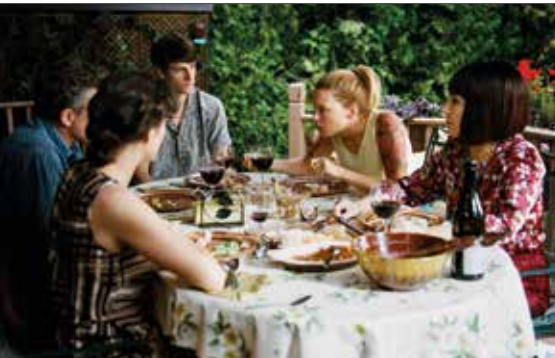
Originaltitel: Juste la fin du monde

DI 20.09.16 – 14:15 SCHAUBURG DO 22.09.16 – 11:30 PASSAGE KINOS