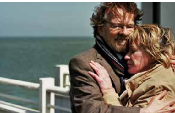
Originaltitel: Achter de Wolken