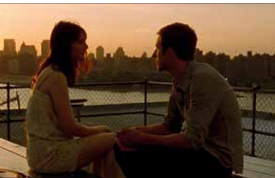
Originaltitel: Ce sentiment de l'été

Ein kleines Dorf im heutigen Indien. Vier Frauen wagen es, sich gegen die Männer und die erdrückenden Traditionen aufzulehnen. Mit Hilfe ihrer Freundschaft und ihres Freiheitswillens bekämpfen sie ihre Dämonen, träumen von der Liebe und darüber hinaus. Es beginnt die Zeit der Frauen ... Der erste internationale Film der indischen Regisseurin Leena Yadav, bei dem sie den Oscar-prämierten TITANIC-Kameramann Russell Carpenter an ihrer Seite hatte, ist ebenso bunt und lebenslustig wie ermutigend. Seit seiner Premiere beim Toronto International Film Festival 2015 wurde DIE ZEIT DER FRAUEN weltweit auf Festivals ein Überraschungshit und in Frankreich zu einem der erfolgreichsten Kinofilme des Frühjahrs 2016.