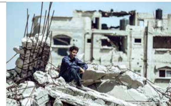
Originaltitel: Ya Tayr El Tayer

Mohammed ist bereits von Kindheit an leidenschaftlicher Musiker und mit einer außergewöhnlichen Stimme gesegnet. Gemeinsam mit seiner Schwester Nour stand er bereits in jungen Jahren auf Familienfeiern auf der Bühne. Während seiner Arbeit als Taxifahrer in Gaza erfährt er, dass ein Vorsingen für die nächste Staffel der Castingshow „Arab Idol“ in Kairo stattfindet. Gegen alle Widrigkeiten versucht er, an dem Casting teilzunehmen und damit nicht nur sein eigenes Leben maßgeblich zu verändern.