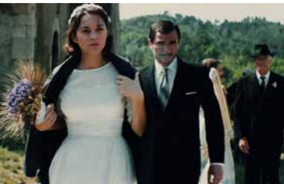
Originaltitel: Mal De Pierres

In einer flamboyanten Mischung aus Drama und Dokumentarfilm erzählt DIE FLORENCE FOSTER JENKINS STORY die unglaubliche Geschichte der „Königin der Dissonanzen“. Der Film taucht dazu in den skurrilen Kosmos einer Frau ein, die sich über Geschlechterrollen und ihren gesellschaftlichen Rang hinwegsetzte und durch ihre phänomenale Talentlosigkeit und Selbstüberschätzung zur Kultfigur und frühen Camp-Vertreterin wurde. In die Rolle der schlechtesten Sängerin aller Zeiten schlüpft mit dem US-amerikanischen Opernstar Joyce DiDonato eine der besten Sängerinnen der Welt. Auf der dokumentarischen Ebene präsentiert der Film sensationelle Archivfunde und lässt namhafte Experten zu Wort kommen, die auch die dunklen Seiten von Jenkins' turbulentem Leben beleuchten. Schritt für Schritt enthüllt der Film so die tragische Tiefe einer schillernden Figur.