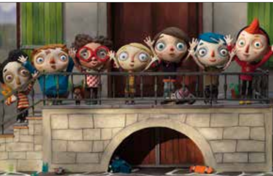
Originaltitel: Ma vie de courgette

Marija, eine junge Ukrainerin, verdient sich ihren Lebensunterhalt als Reinigungskraft in einem Hotel in Dortmund, träumt aber von einem eigenen Friseursalon. Monatlich legt sie etwas Geld beiseite, doch dann rückt eine fristlose Kündigung ihren Traum in weite Ferne. Ohne Arbeit und finanziell unter Druck, sieht sie sich dazu gezwungen, nach anderen Möglichkeiten Ausschau zu halten. Dabei ist sie bereit, ihren Körper, ihre sozialen Beziehungen und zuletzt die eigenen Gefühle dem erklärten Ziel unterzuordnen. Das Spielfilmdebüt von Michael Koch ist das Porträt einer jungen Frau, die am Rand unserer Produktions- und Konsumgesellschaft lebt, sich jedoch nicht auf die ihr zugeschriebene Opferrolle reduzieren lässt. Fordernd, entschlossen und kompromisslos kämpft sie für ein freieres, selbstbestimmtes Leben.