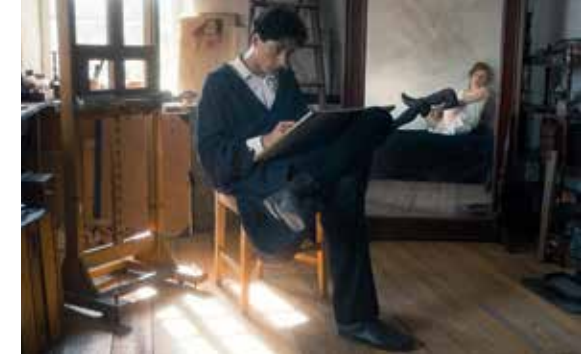
Originaltitel: Egon Schiele: Tod und Mädchen

Wien, Anfang des 20. Jahrhunderts: Egon Schiele ist einer der meist diskutierten, radikalsten und originellsten Künstler seiner Zeit. Sein kreatives Schaffen wird inspiriert von schönen Frauen und dem pulsierende Zeitgeist einer zu Ende gehenden Ära. Im Zentrum stehen dabei seine Schwester und erste Muse Gertrude sowie die 17-jährige Wally, mit der ihn eine wahre, tiefe Liebe verbindet, die durch das Bild „Tod und Mädchen“ unsterblich geworden ist.