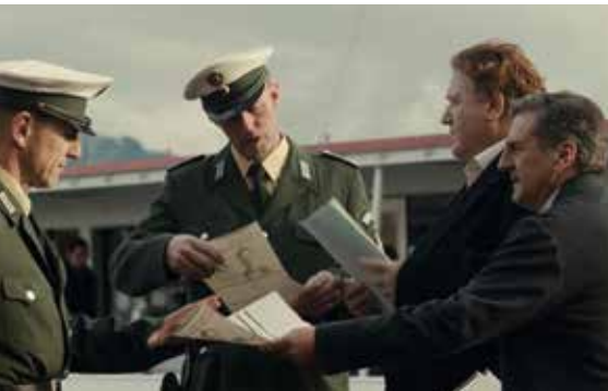
Originaltitel: Au nom de ma fille