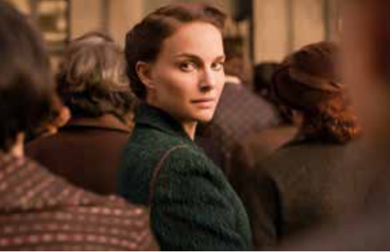
Originaltitel: A Tale of Love and Darkness

R/B: Natalie Portman K: Slwomir Idziak D: Natalie Portman, Gilad Kahana, Amir Tessler Verleih: Koch Films Filmstart: 03.11.2016