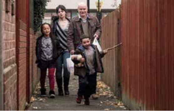
Originaltitel: I, Daniel Blake