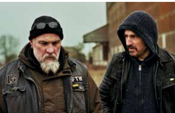
Originaltitel: Les premiers, les derniers